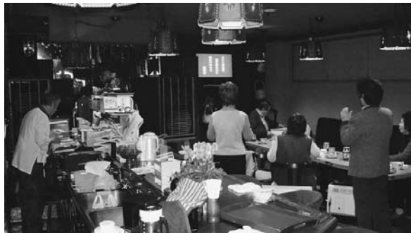
前頭葉を鍛えながらカラ オケ

しながら会員外への片方 向ボランティア活動が出 来ておりません。広辞苑 には「ボランティア」(義 勇兵の意) 志願者。奉仕 者。自ら進んで社会事業 などに無償で参加する人 とあります。仏教で言う 利他の心、布施の心に通 ずるものがあるのではな いでしょうか。利他の心 布施の心を持ってナルク