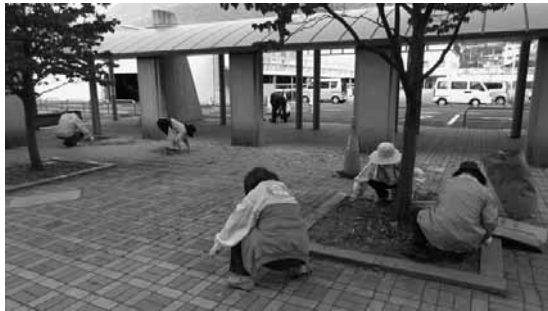
上田医療センター玄関アプローチの草取りをする会員

10月14日、ナルク上田・千曲では独立行政法人国立病院機構「信州上田医療センター」の玄関前庭の草取りを行いました。 丹念に取りました。 玄関のアプローチは見違えるように綺麗になり、清々しさが戻りました。