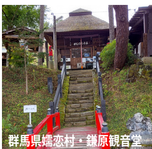
群馬県嬬恋村・鎌原観音堂

色ずき始めた木々を見ながら坂道のぼるとうとうと流れおちる水滴に我的心もあらわれる