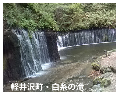
軽井沢町・白糸の滝

色ずき始めた木々を見ながら坂道のぼるとうとうと流れおちる水滴に我的心もあらわれる